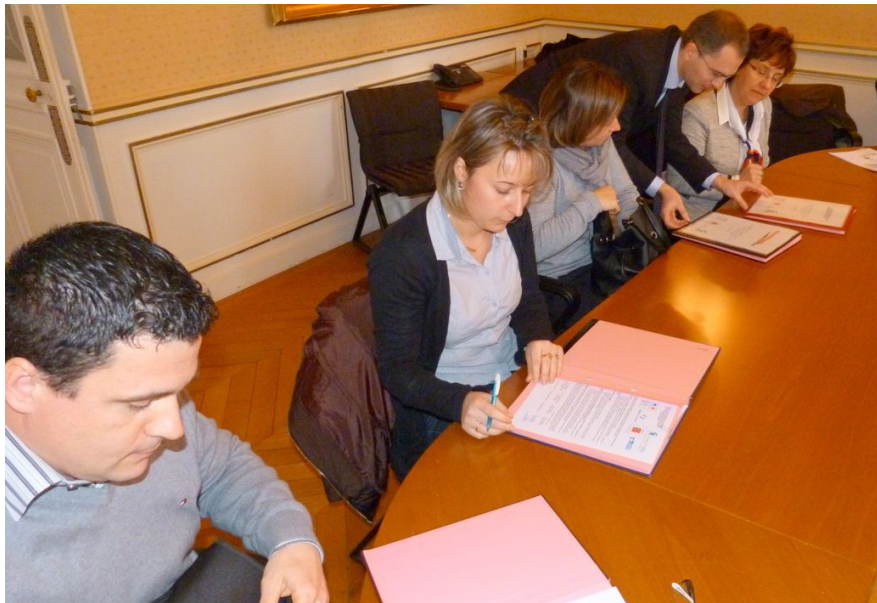
Signature de la charte CO 2 en Préfecture de région

Volontaires et responsables , les entreprises de transports s'engagent pour 3 ans en faveur d'une